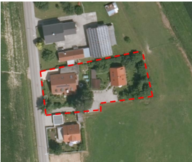
Luftbild (nicht maßstabsgetreu)

Der räumliche Geltungsbereich des Bebauungsplans ergibt sich aus folgendem Kartenausschnitt (Fl. Nr. 943/1, Arzbach der Gemarkung Röhrmoos):