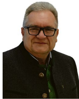
Dieter Kugler Erster Bürgermeister

Der Schützenverein Gemütlichkeit Röhrmoos e.V. feiert das 100-jährige Bestehen. Und ganz besonders ist, dass die neue Vereinsfahne geweiht wird. Das