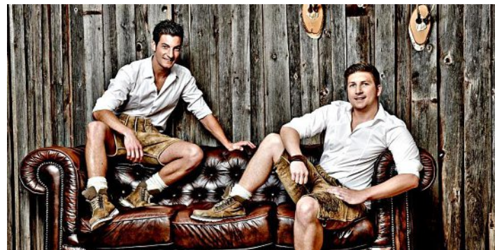
Die Blum-Buam spielen im Gasthaus Doll zum Tanzabend beim Jubiläum auf.

Informationen hierzu können selbstverständlich auf der neuen Homepage der Röhrmooser Schützen www.schuetzen-roehrmoos.de nachgelesen werden.